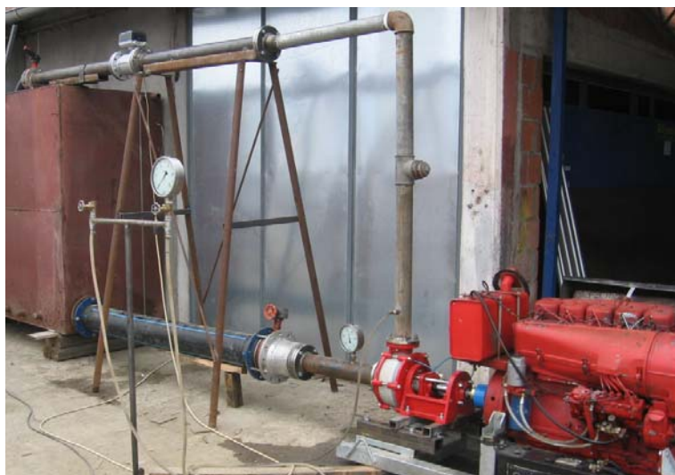
Slika 1. Ispitni štand