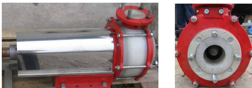
Slika 1. Izgled pumpe

Predmet ispitivanja je jednostepena centrifugalna pumpa sa poluotvorenim kolom, tip pumpe JCP 4"/3"-10" (JCP-Jednostepena Centrifugalna Pumpa, 4"-prečnik usisne priрубnice, 3"-prečnik potisne priрубnice, 10"- prečnik radnog kola). Materijal radnog kola i kućišta je polipropilen.